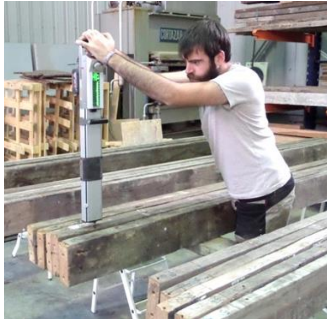
Figura 5. Ensayo resistográfico en eje vertical