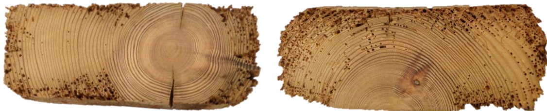
Figura 2. Ejemplo de degradación.

por viga para las vigas más sanas y un máximo de tres rodajas para el caso de las vigas más degradadas.