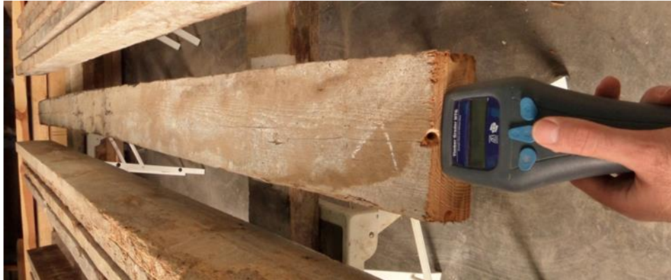
Figura 4. Ensayo con el equipo Timber grader MTG.

Para esta técnica se emplea el Timber Grader MTG, que estima las propiedades mecánicas mediante ondas de impacto. El equipo golpea un extremo de la viga y un sensor registra la velocidad de la onda de choque resultante. A diferencia de los ultrasonidos, esta técnica requiere que la viga esté totalmente aislada de otras superficies para evitar interferencias en la vibración, lo que dificulta su uso en estructuras que ya están puestas en servicio.