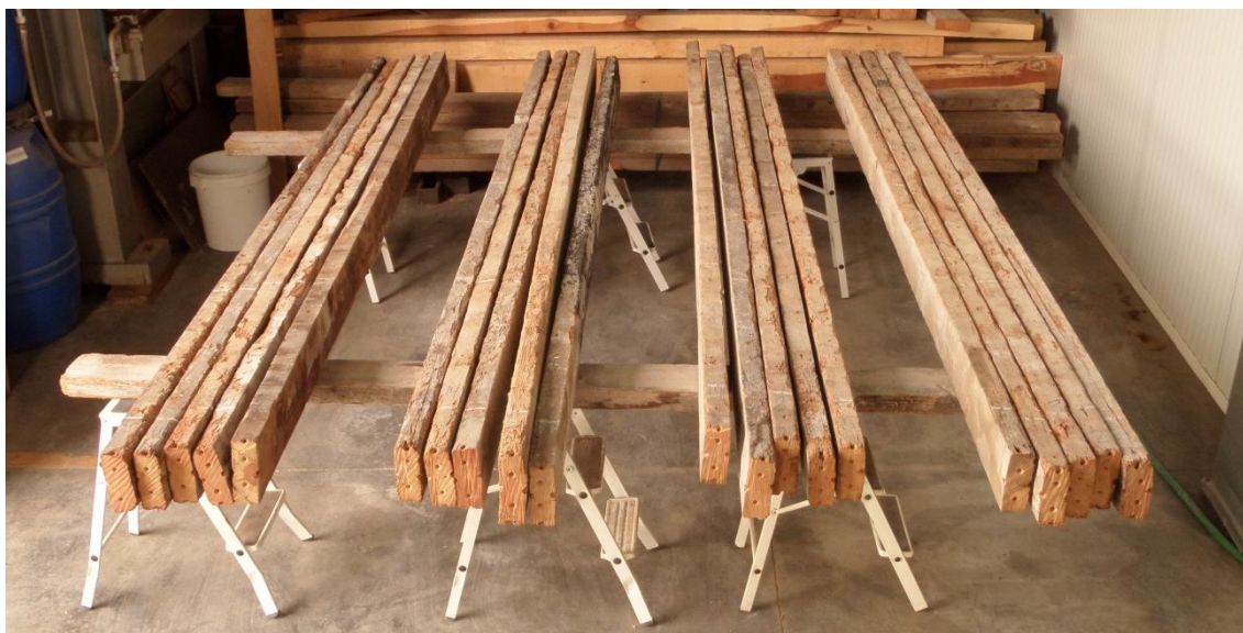
Figura 1. Vigas de uno de los lotes de madera recuperada.

Los lotes tienen las siguiente escuadría y longitud: para la mobila A, vigas de 180x60 mm y una longitud de 4 metros; para la mobila B, vigas de 175x65 mm y una longitud de 3.78 metros; para Pinus sylvestris A, vigas de 150x60 mm y una longitud de 3.8 metros; para el pino silvestre, vigas de 160x60 mm y una longitud de 3,63 metros; y para el abeto, vigas de 200x75 mm y una longitud de 4 metros. Debido a que son vigas recuperadas de demolición, las secciones tienen un margen de error de \pm 5 mm entre ellas, por lo que para los ensayos se han considerado las secciones reales para cada viga.