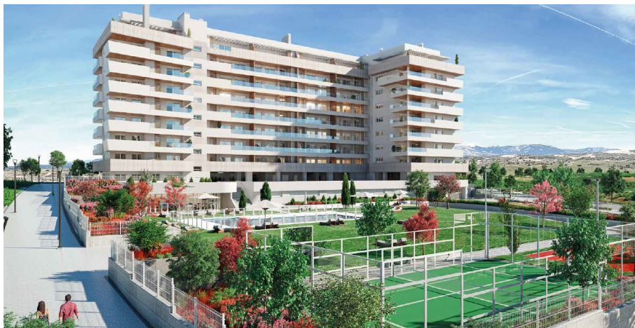
Figura 3. Piloto España