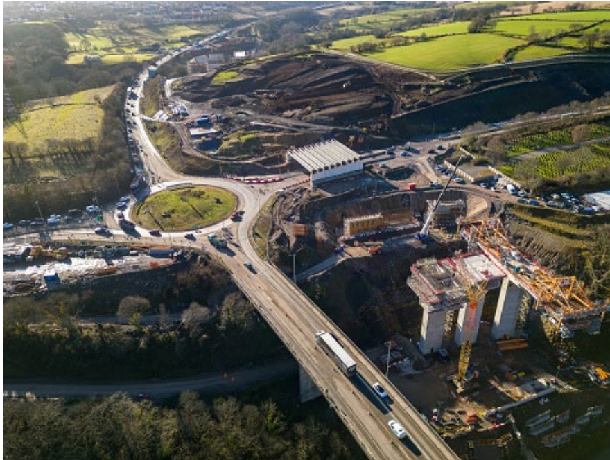
Figura 2. Piloto Reino Unido