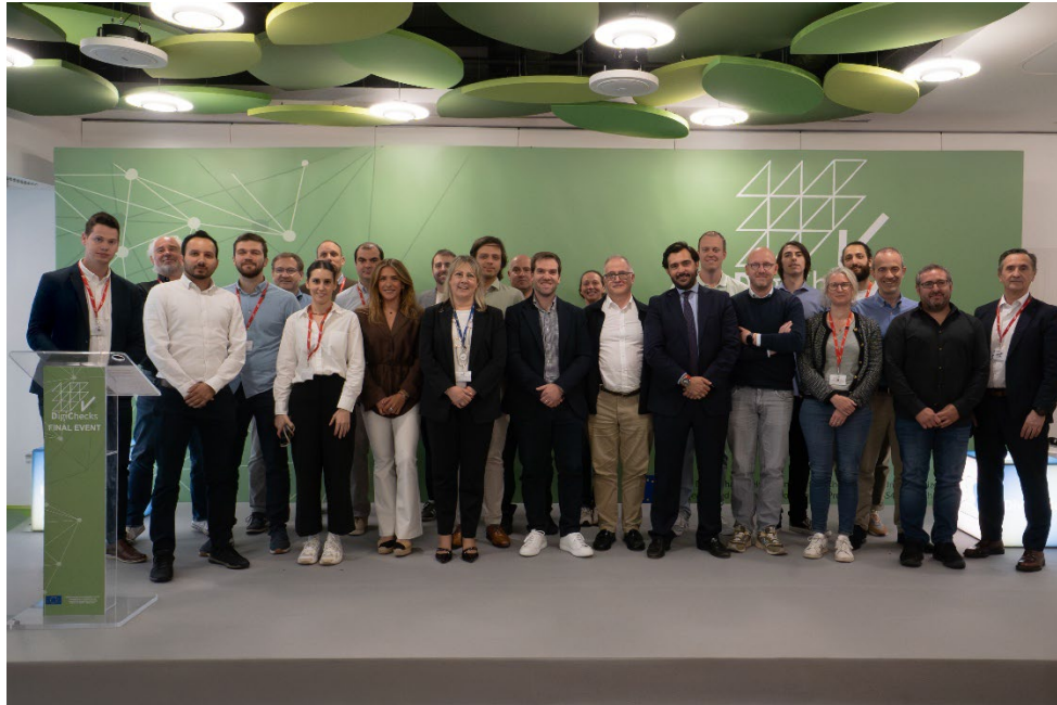
Figura 5. Consorcio DigiChecks

Las 14 entidades europeas que colaboraron en DigiChecks son empresas internacionales de los ámbitos de la construcción, la investigación, la normalización, la digitalización y los servicios auxiliares. Son FCC Construcción , REALIA BUSINESS , Fundación Tekniker , IDP Ingeniería , Medio ambiente y Arquitectura , Ayesa Ibermática , Instituto Ibermática de innovación , Building Digital Twin Association , Neanex , Semmtch , Digital Construction , Bureau Veritas Group , CREE BUILDINGS , Universiteit Gent & innCome .