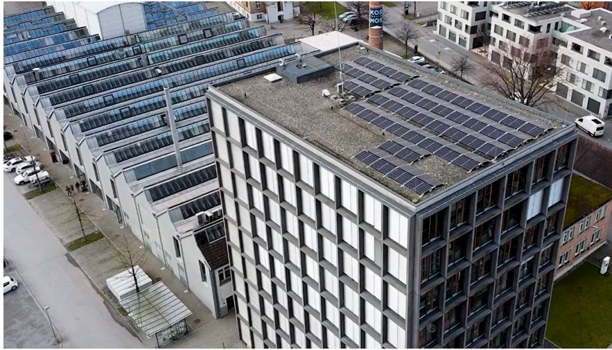
Figura 4. Piloto Austria