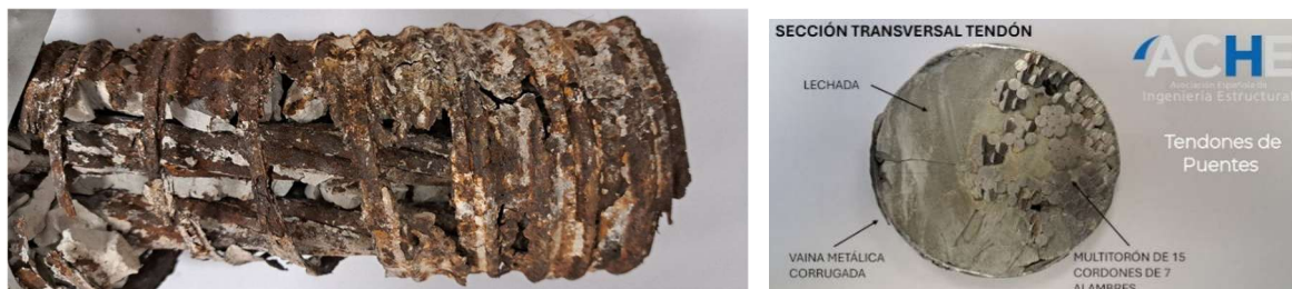
Figura 2. Izquierda: vaina metálica corrugada con procesos avanzados de oxidación. Derecha Sección transversal de un tendón postesado compuesto por cordones de 7 alambres [5].

Este fenómeno resulta especialmente crítico en sistemas pretensados y postesados debido a las elevadas tensiones mecánicas a las que se encuentra sometido el acero. En estas condiciones, mecanismos como la corrosión por picaduras o la corrosión bajo tensión pueden desarrollarse de forma prácticamente inadvertida y derivar en roturas frágiles y repentinas, con consecuencias potencialmente catastróficas para la seguridad estructural.