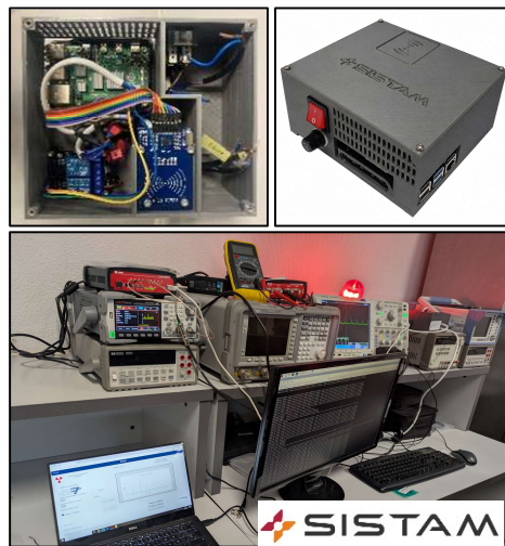
Figura 5. Prototipo funcional de la ICU SISTAM, “E-BOX”

Asimismo, se han realizado primeras sesiones de validación funcional de la unidad centralizada de control (E-box), como etapa previa a su transición hacia un nivel industrial.