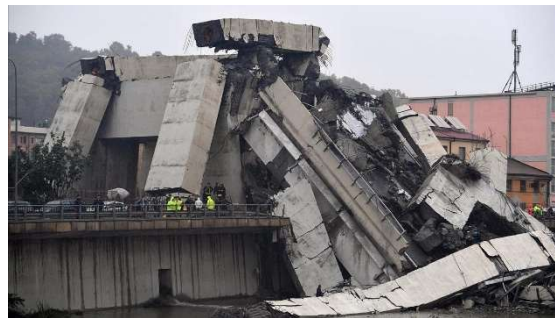
Figura 1. Imagen del colapso del puente Moradi (2018) [4]

La creciente necesidad de garantizar la seguridad y durabilidad de infraestructuras críticas ha impulsado el desarrollo de nuevas técnicas de inspección no destructiva capaces de proporcionar información precisa sobre el estado interno de las estructuras. Las metodologías tradicionales presentan limitaciones en cuanto a profundidad de inspección, resolución y capacidad de caracterización interna.