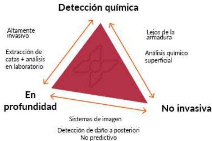
Figura 3. Diagrama de las técnicas convencionales para estudiar corrosión

De acuerdo con la figura a continuación las técnicas actuales (extracción de probetas con análisis posterior de laboratorio, cámaras multispectrales, difracción por rayos X, etc.) que se emplean para analizar la corrosión, son invasivas o se limitan a nivel superficial. Por otro lado, las soluciones no invasivas —como imagen o mediante ultrasonidos— no ofrecen información química y detectan daños solo cuando ya son visibles o detectables macroscópicamente.